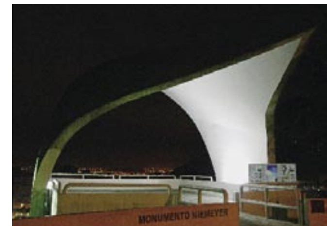
Πάνω: Το Υπουργείο Δικαιοσύνης, στην Μπραζίλια. ■ Αριστερά: Το Προεδρικό Μέγαρο, στην Μπραζίλια.