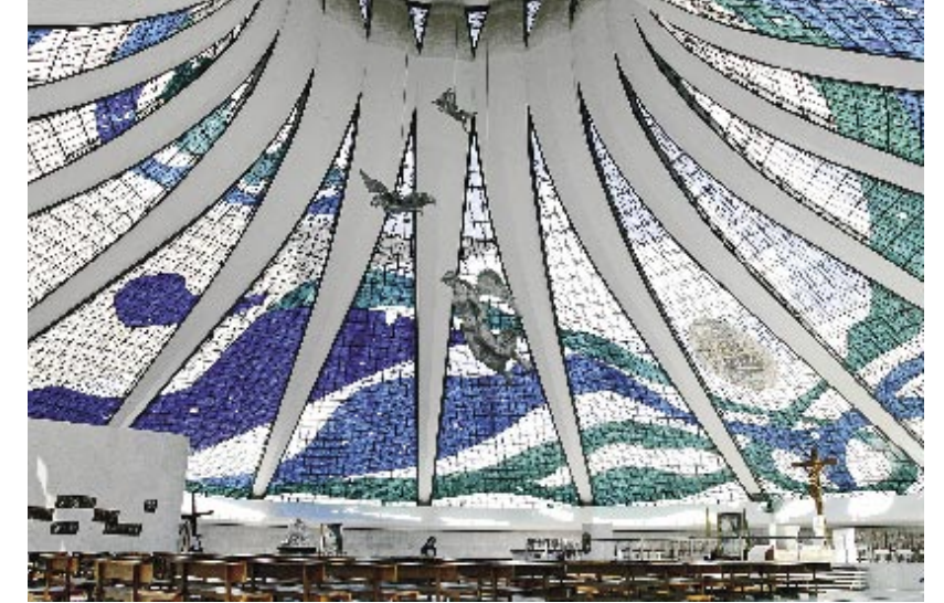
Αριστερά: Πορτρέτο του 100χρονου σήμερα Oscar Niemeyer. ■ Πάνω: Άποψη του εσωτερικού χώρου του Μητροπολιτικού Καθεδρικού Ναού της Μπραζιλία. ■ Δεξιά: Ο Oscar Niemeyer με τον Fidel Castro και τον Κουβανό πρέσβη το 1977. ■ Αριστερά: Μνημείο στην Μπραζιλία προς τιμήν του Juscelino Kubitschek, πρώην Προέδρου της Βραζιλίας. ■ Κάτω: Η γέφυρα των φωτογράφων στη διάσημη λεωφόρο Sambodromo, στο Ρίο ντε Τζανέιρο.